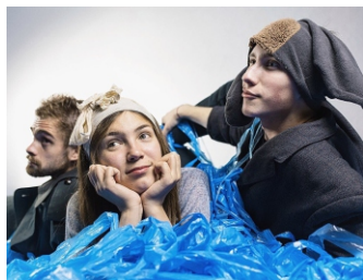
12+ «ТРИЖДЫ ТРИ» Философская притча по пьесе Жака Жюэ

Замаскированный Бог иронизирует над созданным миром и людьми, которые по ошибке получились у него совсем не такими, какими он их задумывал. Пока в один прекрасный момент он не встречает ту, которая обращает все его естество в русло непреодолимого желания стать человеком, чтобы познать все радости несовершенного земного бытия..